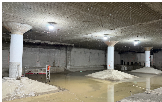
De kelder van de voormalige V&D

Het leegslopen van het interieur en de winkelfwerking, zoals plafonds, vloeren etc., verloopt volgens plan. Inmiddels is ook de bouwplaats aan de voorzijde van het pand aanwezig en daarvoor zijn de bomen tijdelijk verplaatst, zodat ze aan het eind van het project weer teruggeplaatst worden. De bouwschutting wordt nog mooi aangekleed.