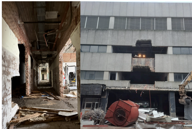
Linker foto is op de verdieping en de rechter foto is de achterzijde van het pand waar het materiaal wordt afgevoerd